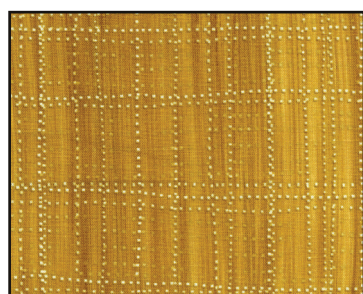
cor 53 - forro