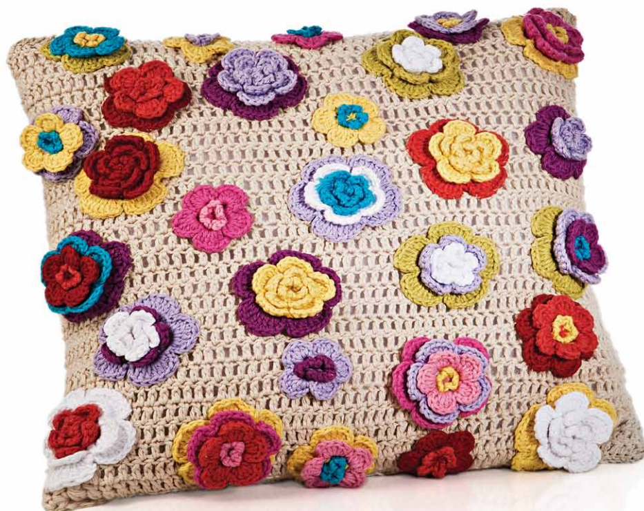
Almofada floral colorida

Costure as duas partes (frente e costas), deixando a abertura para colocar o enchimento.