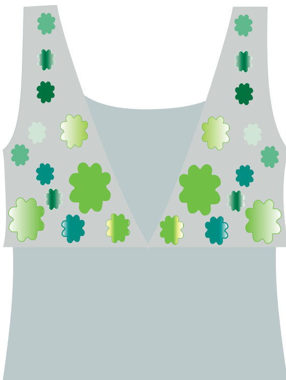
Esquema de cores e montagem

Com a ag. Tapestry Corrente , pregue os motivos com pequenos pontos, distribuindo os conforme o esquema de cores.