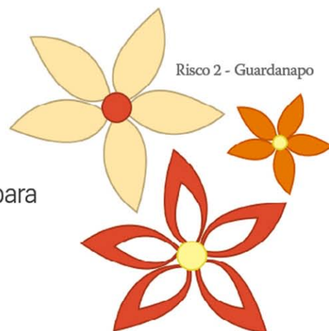
Risco 2 - Guardanapo

Texto Aline Ribeiro | Foto Mônica Antunes | Produção Vera Lúcia Ayres