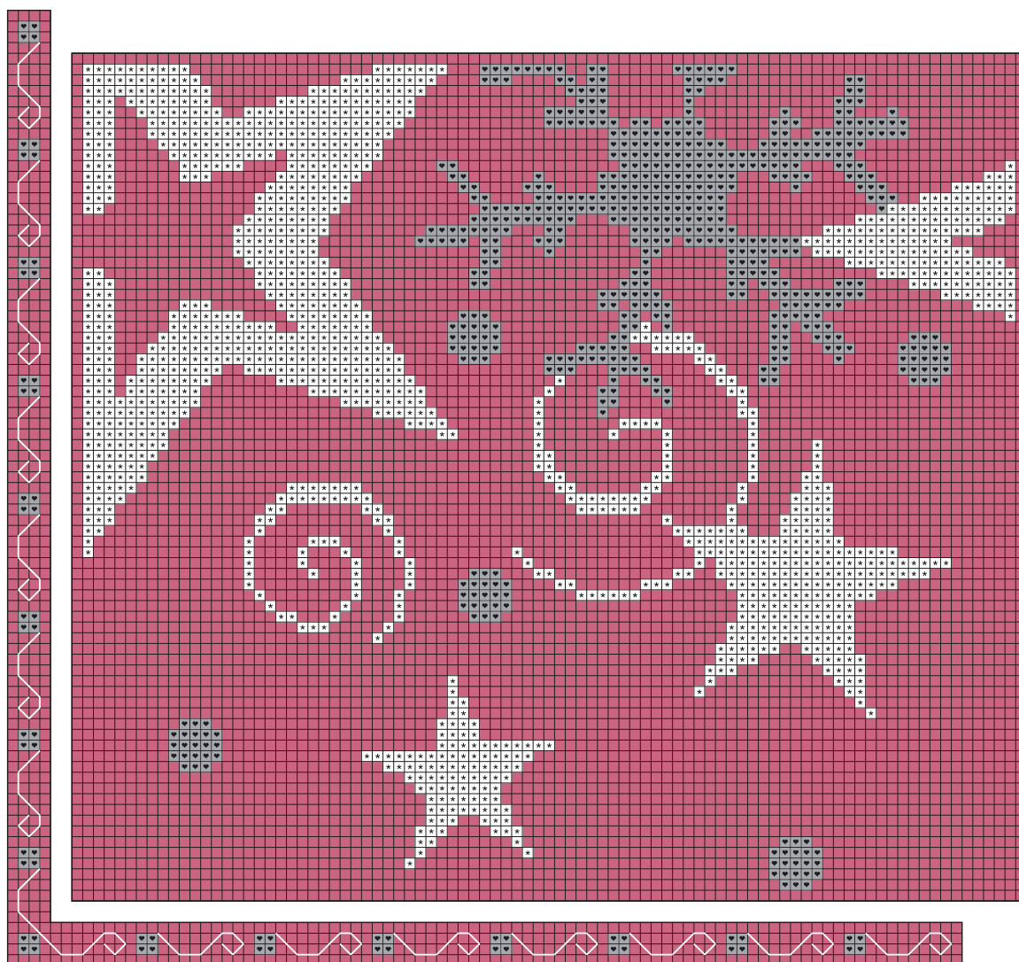
Toalha de mesa